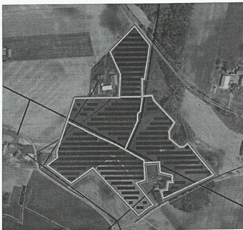
Rysunek 1. Plan nasadzeń zieleni izolacyjnej zgodny z Kip (czerwone linie).

pospolity, dereń świdwa, bez czarny, tarnina, głóg, szakłak pospolity, trzmielina, kruszyna pospolita, leszczyna pospolita, czeremcha zwyczajna, głóg jednoszyjkowy, bez koralowy, kalina koralowa, berberys zwyczajny. Ewentualne przycinanie krzewów prowadzić poza okresem lęgowym ptaków przypadającym w terminie od 1 marca do 31 sierpnia lub w dowolnym terminie po potwierdzeniu przez specjalistę przyrodnika, maksymalnie na 2 dni przed przycięciem, braku aktywnych lęgów ptaków oraz rozrodu zwierząt w obrębie krzewów przeznaczonych do przycięcia.