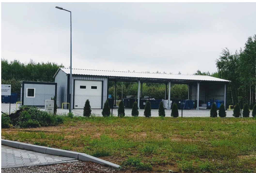
Punkt Selektywnego Zbierania Odpadów Komunalnych w Tłuchowie – fot. Iwona Strzałkowska.

W lipcu 2018r. zakończono roboty budowlane na obiekcie punktu selektywnego zbierania odpadów komunalnych w Tłuchowie przy ul. Leśnej. Wykonano wiatę, ustawiono kontener biuro-socjalny, wagę samochodową, utwardzono i ogrodzono teren oraz wyposażono w instalację elektryczną, wodociągowo –kanalizacyjną.