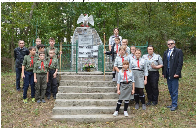
Uroczyste pobranie ziemi z miejsca mordu mieszkańców powiatu lipnowskiego w Karnkowie/Kolankowie