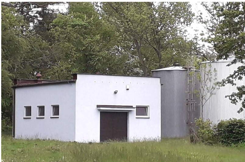
Stacja Uzdatniania Wody w Jasieniu, fot. Andrzej Kurowski