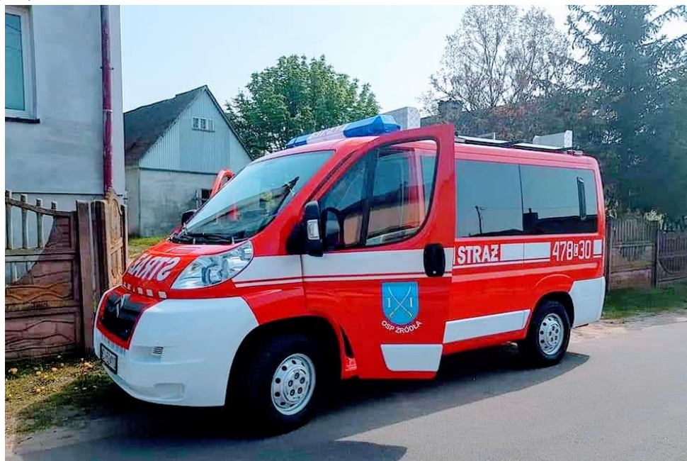
Samochód strażacki OSP Źródła.

W 2018 roku Gmina udzieliła dofinansowania dla Ochotniczej Straży Pożarnej w Źródłach w wysokości 40 873,50 zł (kwota po rozliczeniu) na zakup samochodu strażackiego. Część środków finansowych tj. kwota 9 800,00 zł pochodziła ze środków dotacji otrzymanej na ten cel ze Starostwa Powiatowego w Lipnie. Przy współudziale otrzymanych środków finansowych Ochotnicza Straż Pożarna w Źródłach zakupiła samochód specjalny Citroen Jumper za kwotę 59 200,00 zł.