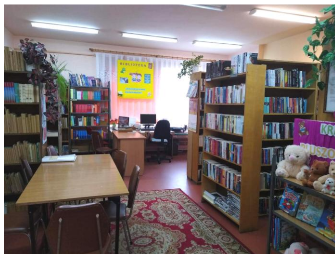
Filia Biblioteczna w Mysłakówku, fot. Sylwia Bonkowska