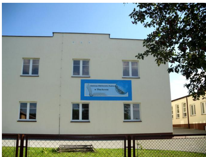
Budynek Gminnej Biblioteki Publicznej w Tłuchowie

Posiada jedną filię biblioteczną w Mysłakówku. Zatrudnia 4 osoby / 2,95 etatu/ w tym trzy osoby zatrudnione na czas nieokreślony i jedną osobę w ramach prac interwencyjnych na czas określony.