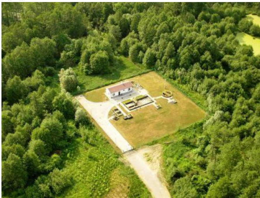
Oczyszczalnia ścieków

Zgodnie z umową zawartą z Samorządem Województwa w Toruniu przedsięwzięcie zostało dofinansowane z programu „Gospodarka wodno-ściekowa” w ramach poddziałania „Wsparcie inwestycji związanych z tworzeniem, ulepszeniem lub rozbudową wszystkich rodzajów małej architektury, w tym inwestycji w energię odnawialną i w oszczędzanie energii” objętego Programem Rozwoju Obszarów Wiejskich na lata 2014-2020 do kwoty 699 679,00 zł. W celu prefinansowania zadania Gmina na korzystnych warunkach zaciągnęła pożyczkę z WFOSiGW w Toruniu w wysokości 699 679,00 zł, która została spłacona bezpośrednio po otrzymaniu dofinansowania.