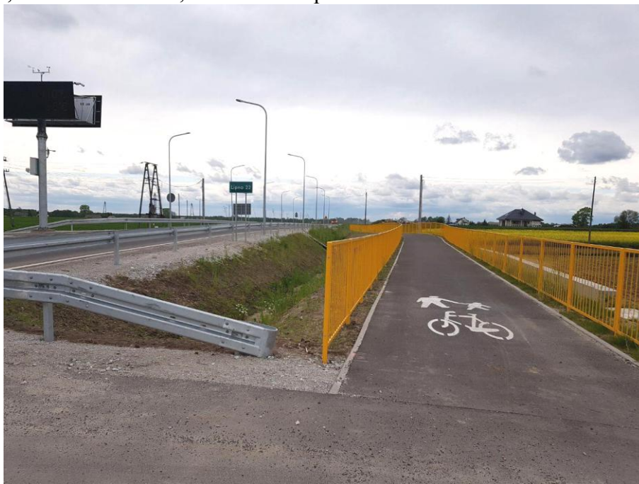
Ścieżka pieszo-rowerowa wzdłuż drogi nr 559, fot. Iwona Strzałkowska.

Inwestycja jest realizowana od 2017 roku wspólnie z Samorządem Województwa Kujawsko - Pomorskiego. Planowane łączne nakłady finansowe to kwota 711 804,00 zł. Kwota 589 590,00zł w formie dotacji celowej dla Samorządu Województwa wydatkowana została w 2018 roku. Zaplanowano, że kwota 122 214,00 zł zostanie przekazana w 2019 roku.