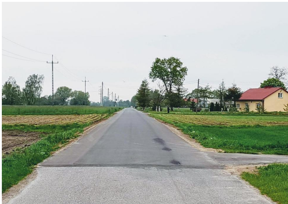
Droga gminna Źródła - Kolonia Źródła, fot. Iwona Strzałkowska.

Przebudowano odcinek drogi gminnej Źródła – Kolonia Źródła. Prace polegały na wykonaniu nawierzchni asfaltowej na odcinku o długości 665,0 mb, szerokości jezdni 4,0 mb.