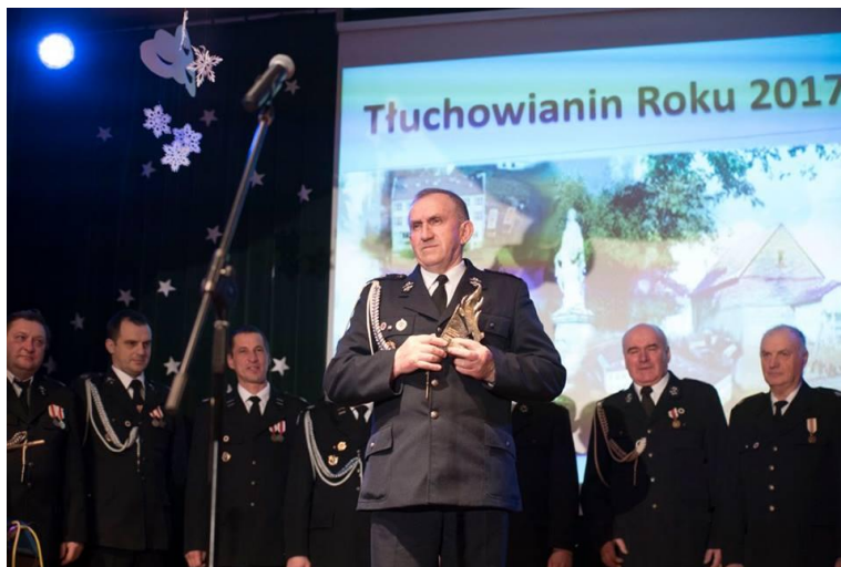
Tłuchowianin Roku 2017, źródło: https://www.facebook.com/goktluchowo/

W 2017 tą nagrodę otrzymała Ochotnicza Straż Pożarna w Tłuchowie. Uroczystość uświetniła swoim występem Dorota Osieńska.