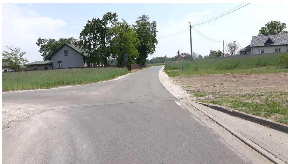
Droga gminna Borowo-Mokówko

Przebudowano odcinek drogi gminnej Borowo – Mokówko. Prace polegały na wykonaniu nawierzchni asfaltowej na odcinku o długości 968,0 mb, szerokości jezdni 4,0 mb.