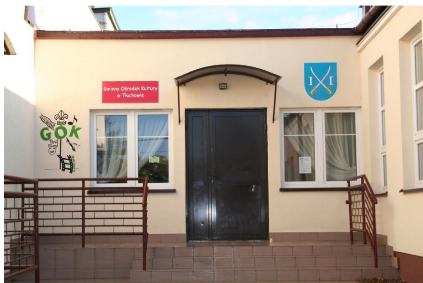
Budynek Gminnego Ośrodka Kultury w Tłuchowie

Do podstawowych zadań Ośrodka należy w szczególności rozpoznawanie, rozbudzanie i rozwijanie zainteresowań i potrzeb kulturalnych, tworzenie warunków dla rozwoju amatorskiego ruchu artystycznego, kształtowanie wzorców aktywnego uczestnictwa w kulturze, popularyzowanie wizerunku gminy poprzez udział w konkursach, przeglądach, festiwalach, wystawach, itp. o zasięgu ponadgminnym.