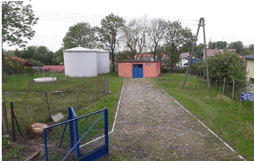
Stacja Uzdatniania Wody w Tłuchowie